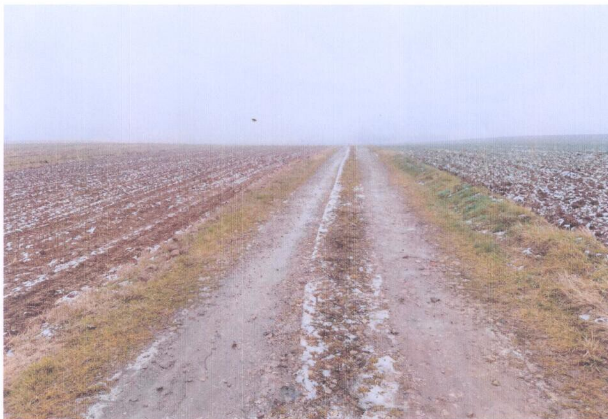
Fot . 1